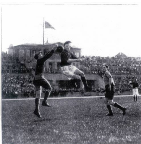
Schlusspiel um die Bundesmeisterschaft. Adler 08 Berlin—Frankfurt-Westend 5:4. Frankfurt's Torwart in Wehrübung. Gefährdetes Foulen war seine Spezialität.

Das bedeutendste Ereignis für alle Arbeitersportlerinnen und Sportler war 1925 die Arbeiterolympiade im Frankfurter Waldstadion. Die Sportler halfen, als es knapp wurde für die Stadt, das Stadion fertig zu bauen, die Gäste mussten in den Schulturnhallen untergebracht, Großveranstaltungen und Umzüge organisiert werden. Die Vorrundenspiele im Fußball wurden stadtweit ausgetragen, u.a. auf drei Plätzen an der Sondershausenstraße.